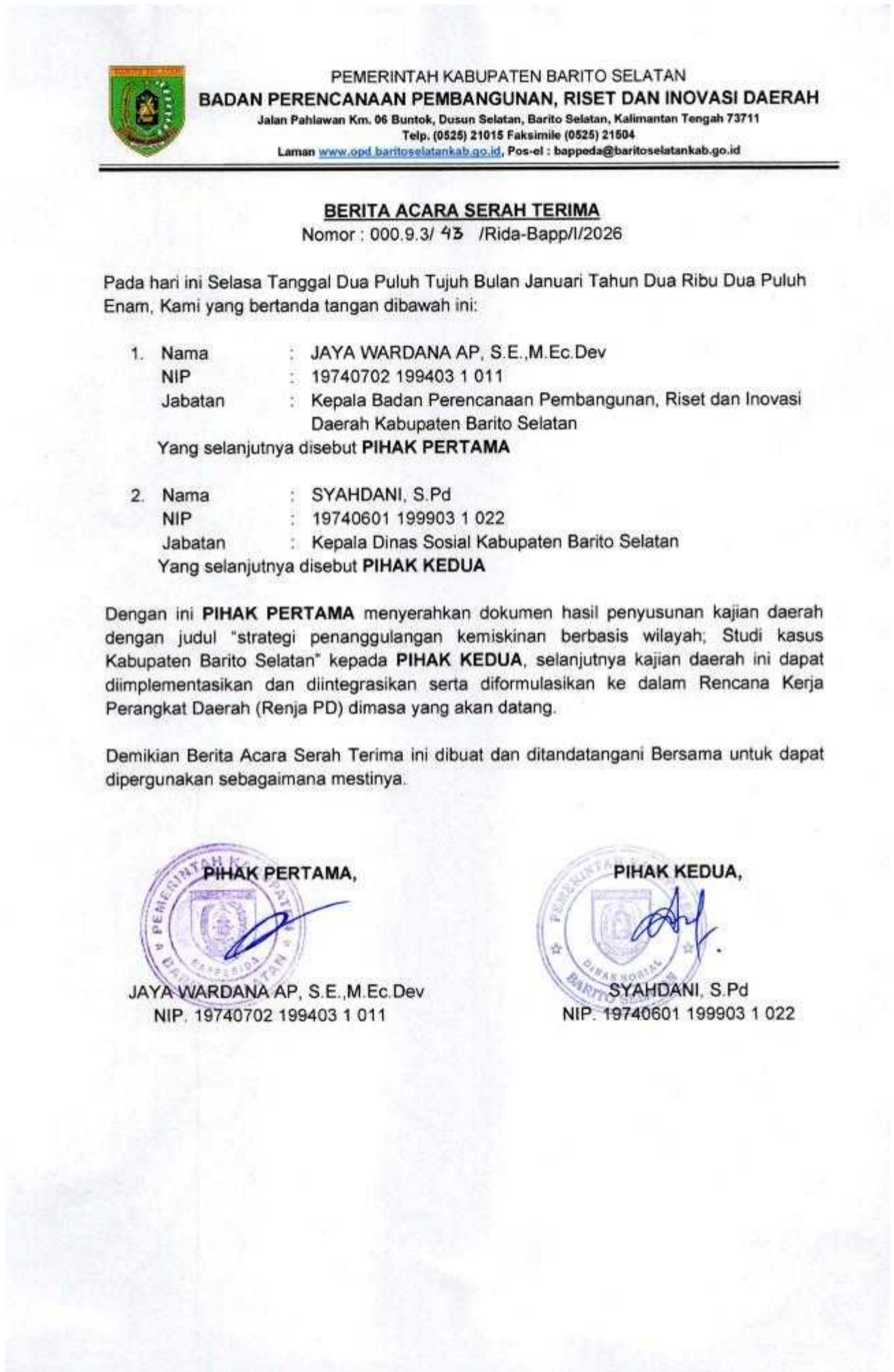
Gambar 3. 1 Berita Acara Serah Terima Dokumen Hasil Penyusunan Kajian Daerah