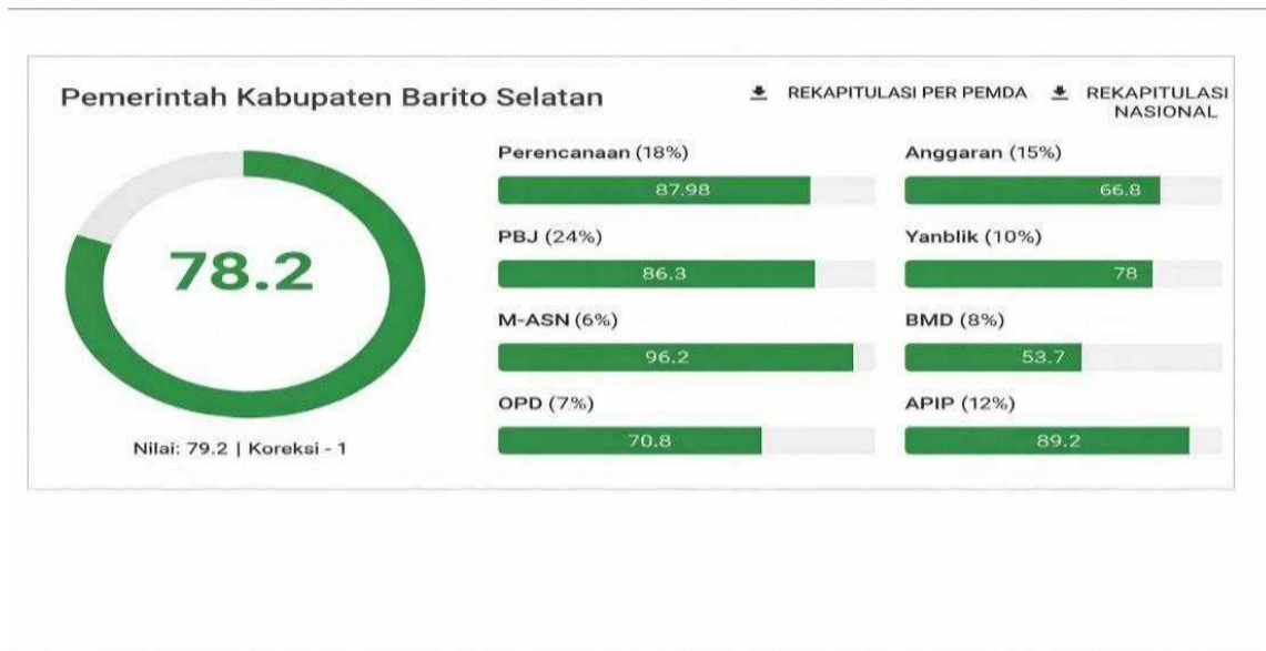
Tabel 3. 4 Progres Capaian Area Perencanaan